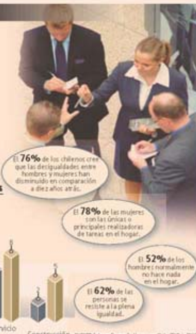
FUENTE: Informe Desarrollo Humano en Chile, 2010 del PNUD.